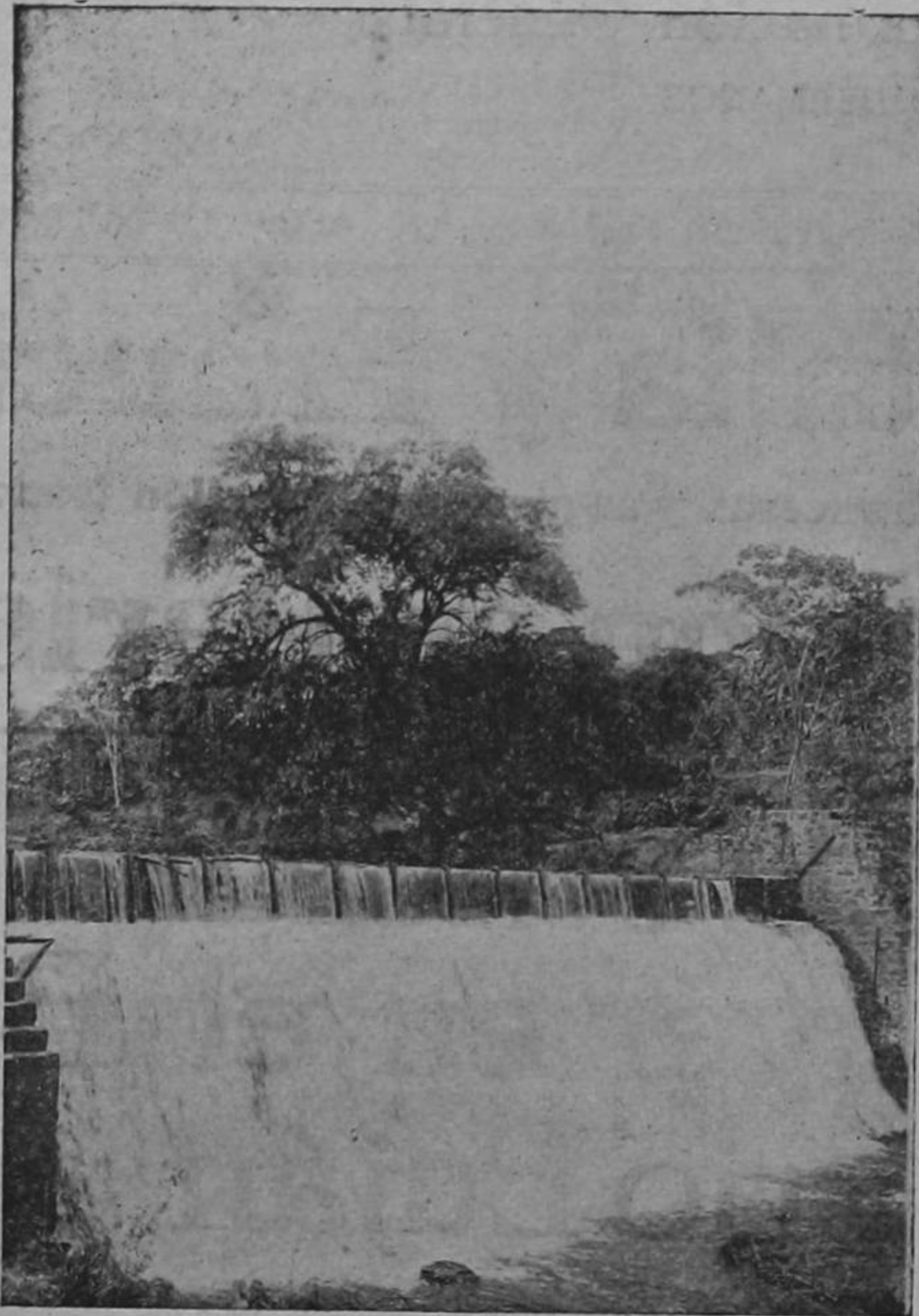
Aspecto de la Planta de Los Anonos